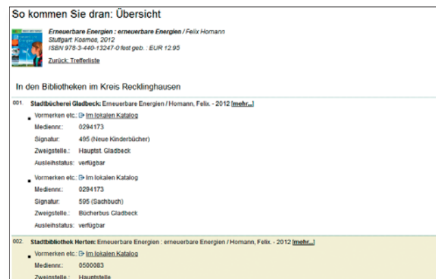
So kommen Sie dran – Ergebnis der Verfügbarkeitsrecherche (Stadtbücherei Gladbeck)

Der Einzeltreffer liefert zusätzliche Informationen, evtl. Abstracts, Inhaltsverzeichnisse und Angaben zum Standort. Über einen Link zum Katalog Ihrer Bibliothek haben Sie ggf. die Möglichkeit, den Titel zu bestellen oder vorzumerken. Bei elektronischen Quellen führt ein entsprechender Link zum Volltext.