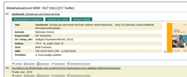
Suchergebnisse und Einzeltreffer (Stadtbücherei Gladbeck)

Die Suchergebnisse werden in einer Trefferliste angezeigt. Detaillierte Informationen erhalten Sie beim