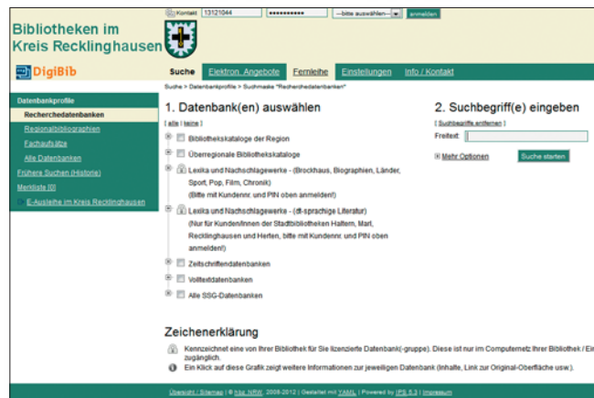
Suchmaske (Bibliotheksverbund Kreis Recklinghausen)

Sie suchen Literatur für Schule, Studium und Beruf? Sie wollen sich aber weder durch den Dschungel der Treffer von Google kämpfen noch in zahlreichen Datenbanken immer erneut die gleiche Anfrage stellen? Dann ist die Digitale Bibliothek (DigiBib) mit ihrer gleichzeitigen Suche in unterschiedlichen Quellen Ihr Weg zur relevanten Literatur.